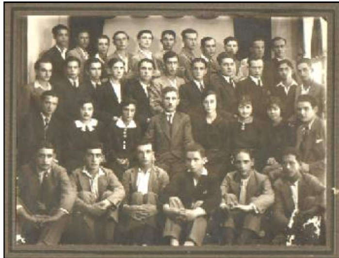
Φωτ. 18 Σχολική περίοδος 1931-1932. Τελειόφοιτοι.