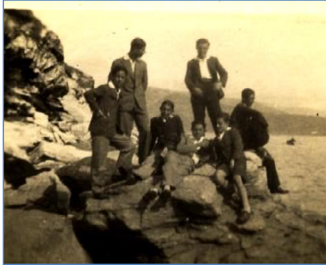
Φωτ. 5 Μαθητές της Δ' Τάξεως του Γυμνασίου Καβάλας σε χαρούμενες στιγμές κάπου στα βραχάκια της «Πλάκας» (Αγ. Βαρβάρα) 1932.