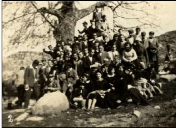
Φωτ. 9 Μαθητές της Δ' Τάξεως σε μαθητικές εκδρομές, 1932.