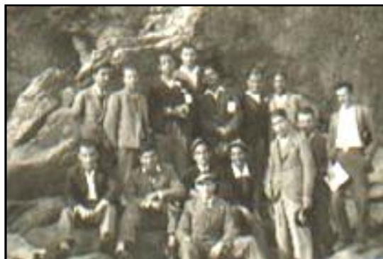
Φωτ. 19 Μαθητές της ΣΤ' τάξεως του Γυμνασίου Καβάλας σε εκδρομές. 1932