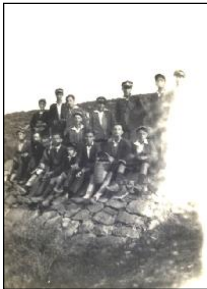
Φωτ. 10 Μαθητές της Δ' Τάξεως σε μαθητικές εκδρομές 1932.