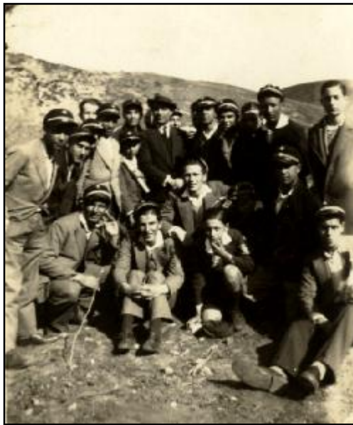
Φωτ. 8 Μαθητές της Δ' Τάξεως σε μαθητικές εκδρομές 1932.