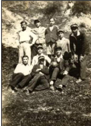
Φωτ. 11 Μαθητές της Δ' Τάξεως σε μαθητικές εκδρομές 1932.