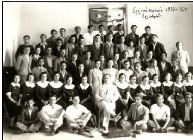
Φωτ. 17 Σχολική περίοδος 1933-1934. Τελειόφοιτοι.