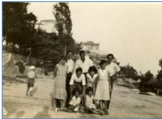
Φωτ. 14 Παιδιά Γυμνασίου και Δημοτικού της συνοικίας της Αγίας Βαρβάρας στον χωματόδρομο λίγο μετά το πρώην Νοσοκομείο, πριν ανοιχθεί η οδός Αμερικανικού Ερυθρού Σταυρού (1930).